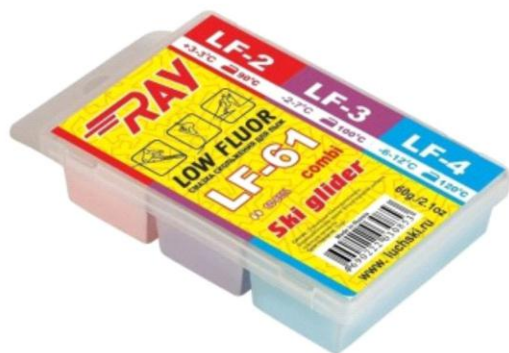
Парафин RAY LF-61 +3-12°C смазка скольжения комбинированная LF2+LF3+LF4 (60г)