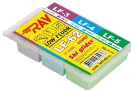
Парафин RAY LF-62 -2-30°C смазка скольжения комбинированная LF3+LF4+LF5 (60г)