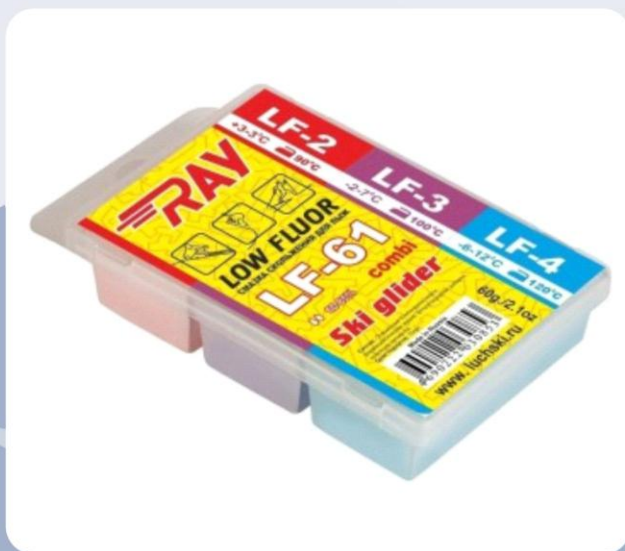
Парафин RAY HF-61 +3-12°C смазка скольжения комбинированная HF2+HF3+HF4 (60г)