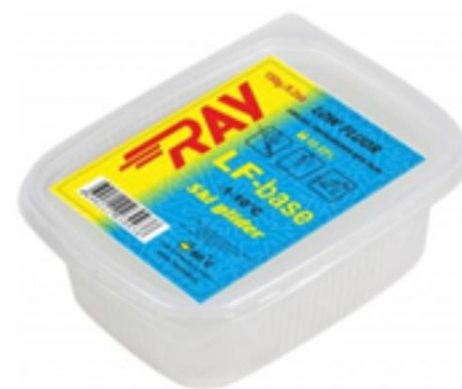
LF-6 BASE мягкий сервисный грунт с малым содержанием фтора, t плавления 60°C, применяется для очистки (промывки), грунтовки новых лыж и лыж после циклевки.