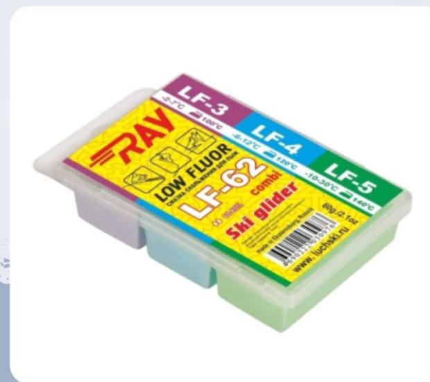
Парафин RAY HF-62 -2-25°C смазка скольжения комбинированная HF3+HF4+HF5 (60г)