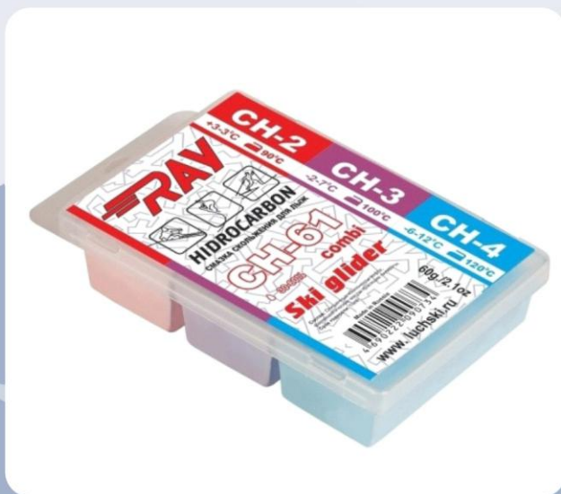
Парафин RAY CH-61 +3-12°C смазка скольжения комбинированная CH 2 +CH 3 +CH 4 (60г)