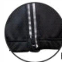
Боковая молния на всю длину брюк