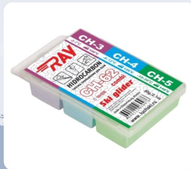
Парафин RAY CH-62 -2-30°C смазка скольжения комбинированная CH 3 +CH 4 +CH 5 (60г)